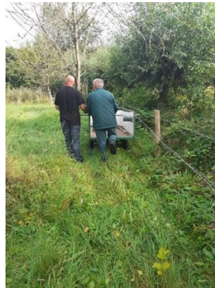
Vervanging rasters Kersenboomgaard