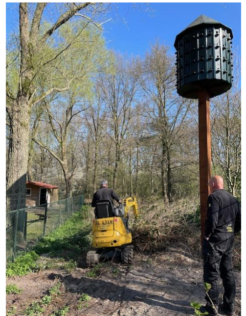
Doorsteek Groenhoeve natuurpad