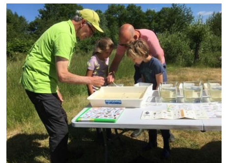
Slootjesdag IVN-sVLU juni 24

De financiële verslaglegging is in handen van Jos Vloet. De stichting heeft een ING rekening (NL20 INGB 0006 3059 21) en een ASN spaarrekening (NL55 ASNB 8804 6547 67). De inkomsten van de sVLU bestaan uit een jaarlijkse bijdrage via SNL, Landschapsbeheer Brabant, Staatsbosbeheer en verder projectsubsidies bij onderhoud en aanleg van (nieuw) groen, de verkoop van gesnoeid hout, akkerbeheer, evenals donaties van Vrienden van het Udens Landshap (VvhUL). Van adverteerders is een kleine donatie ontvangen. De uitgaven bestaan uit het aanschaffen van plantmateriaal, handschoenen, snoei- en zaaggereedschap, koffie / soep, alsmede enige organisatiekosten.