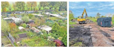
Waar ooit boontjes groeiden, staat straks een heel bos

De 88 tuintjes van de Hoopsterfening in Lilloer zijn nu veranderd in een heus bos. Het gebied is nu een heus bos met 100 genodigden die op de Natuurwerkdag.NL het Wijstbos aangeplant.