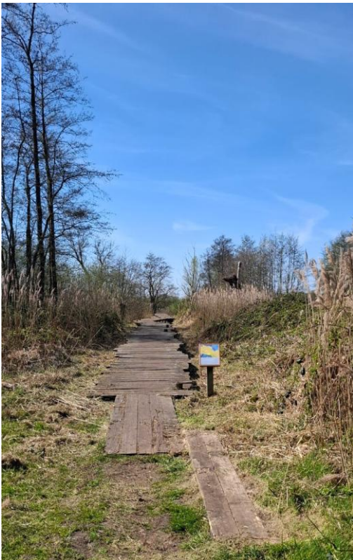
Onderhoud aan de knuppelbrug Annabos