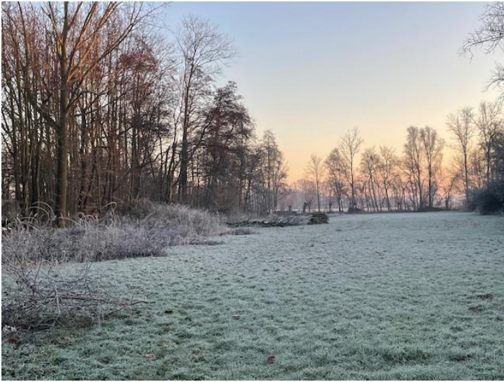
Het opknappen van zuidzijde Oerbos op Kooldert