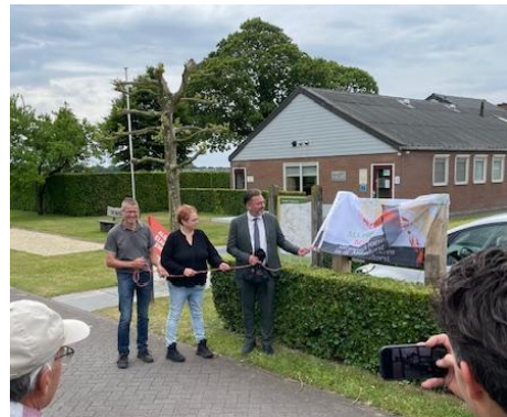
Heropening ommetje wandelroute Nabbegat-Schajkse Heide

In 2021 heeft de sVLU voor stichting Ark maar liefst 30.000 bosplantsoen aangelegd aan de oostzijde van de Maashorst. De realisatie in november 2021 geschiedde in een heuse plantzesdaagse waar ook de Boomfeestdag deel van uit maakte. Deze werkzaamheden werden mede ondersteund door collega's van IVN-Bernheze.