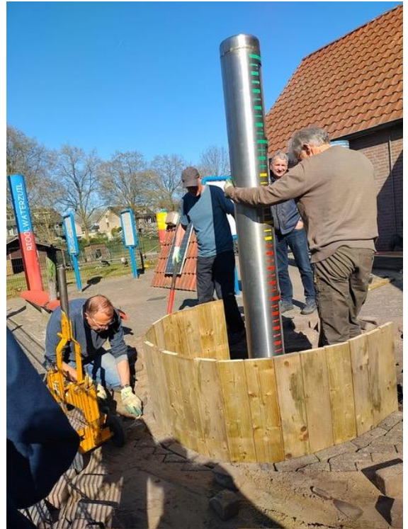
Opknappen Waterpeilmeter op de Groenhoeve