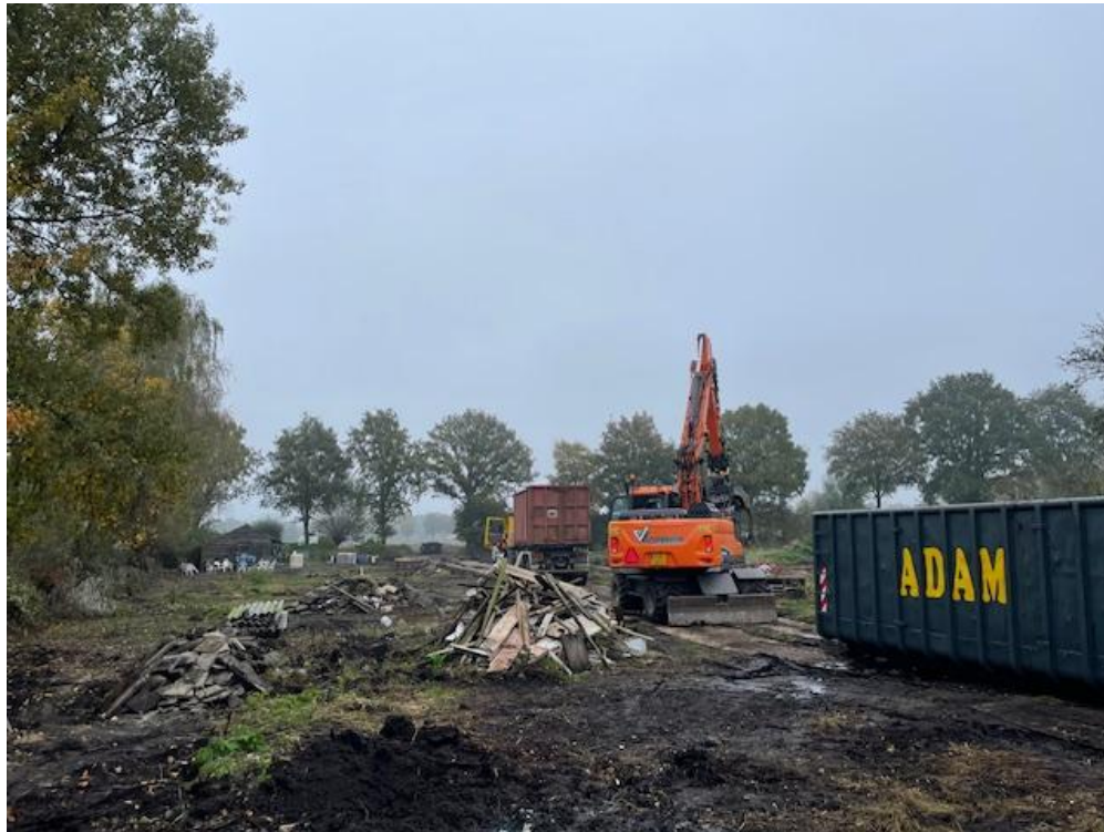
Een van de vele momenten op de Hoge Burcht in 2024. De ene na de andere container werd gevuld met: glas, puin, ijzer, hout of restmaterialen van het 1 hectare grote voormalige volkstuintencomplex aan de Hoge burchtweg.