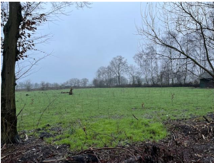
Vlak voor 2025 was het gezaaide graan in het jonge Wijstbos flink gekiemd en de jonge aanplant ..... in winterrust.