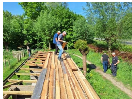
Vervanging dak van de bijenstallen