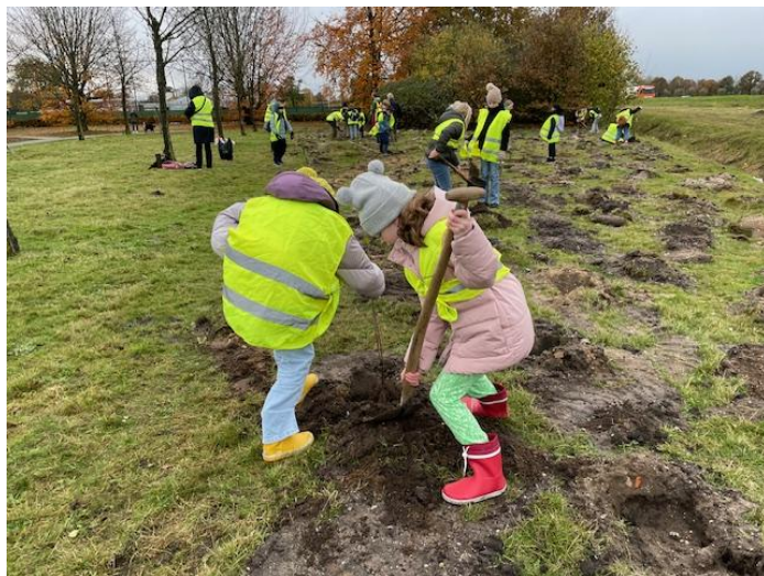
Aanleg struweelbosjes in Landschapspark A50 tijdens een sneeuwrijke Boomfeestdag november 2024

Bron: E. de Groot, G. Schotveld en W. Peters; *) = incl knot-es/-els/-populier **) = vanaf 1995 incl bosplantsoen voor de boomplantdag én vanaf 2002 ook voor de landelijke Natuurwerkdag op de 1 e zaterdag van november.