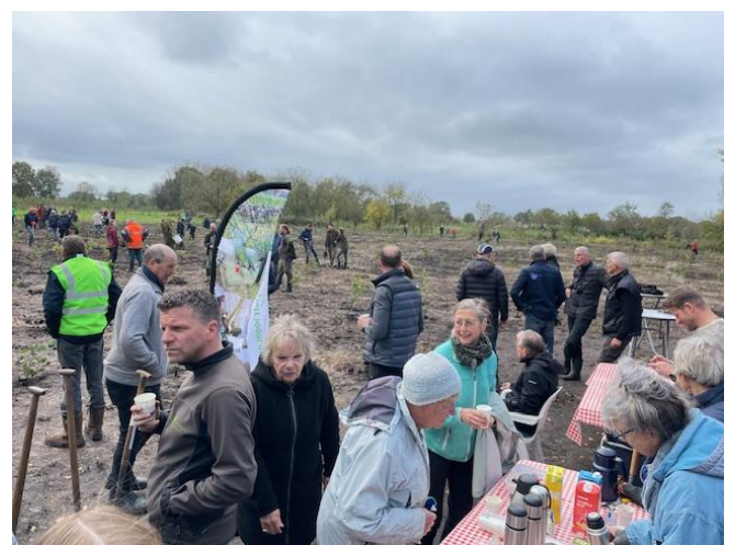
De 88 tuintjes zijn vakkundig gesloopt, afgevoerd en met 100 genodigden is op de Natuurwerkdag.NL het Wijstbos aangeplant