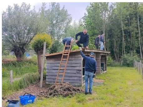
Ook het dak van onze bijenstallen is dit voorjaar vervangen.