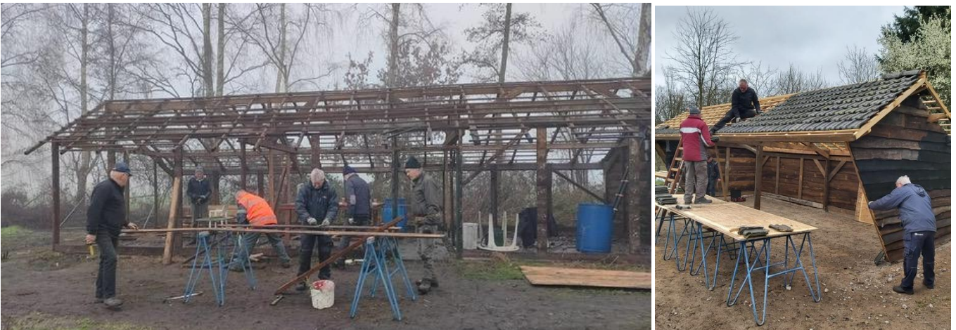
De oude veldschuur op de Hogebruchweg hebben we in zijn geheel afgebroken en achter de werkplaats, iets kleiner, herbouwd als karschop.

In 2024 heeft sVLU een projectomschrijving ingediend bij NL Doet voor werkzaamheden op Bedaf en hebben een kleine donatie ontvangen. Gelet op eerdere bloemrijke successen met het akkerbeheer op Hoogveld en Goorkens blijft de sVLU akkerranden adviseren en promoten. De akker op Bedaf is in het wintergraan gezet waar klaprozen en korenbloemen ontluiken. Met het graan hebben we tal van beplantingen zoals die op de Hogebruchweg ingezaaid om onkruidengroei voor te zijn.